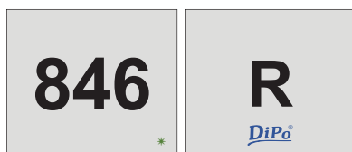
Karta s výsledkem